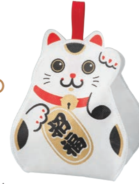
まねきねこ LE162 S 内寸：138×107×107 外寸：144×176×113 ◎ 開口部は幅 92×奥行 62(mm)