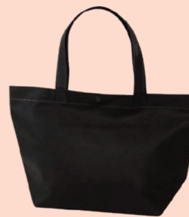
カジュアルトート 特小