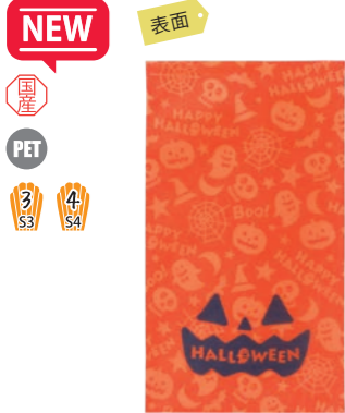
ソフトバッグFP HWポップカラフル柄 LB061DN S3 S 53/150×250 54/170×300