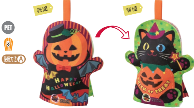
パペット 小パンプキンキャットFP LA438 S 内寸：119×119×60 外寸：187×192×60 M PP不織布