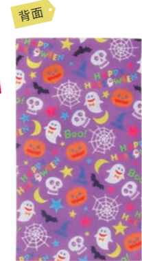
ソフトバッグFP LB062DN S4