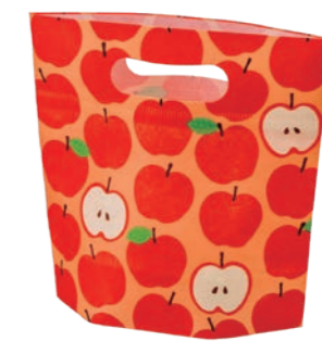
小判抜きバッグミニFP LB065CX しろごろりんご柄 S 内寸：110×140×80 外寸：110×190×80 ◎ 納品時の横幅 190(mm)