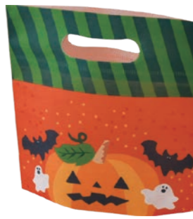
小判抜きバッグ ミニ F P