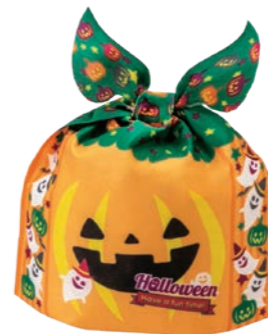
タイパンプキン ハロウィンゴースト F P