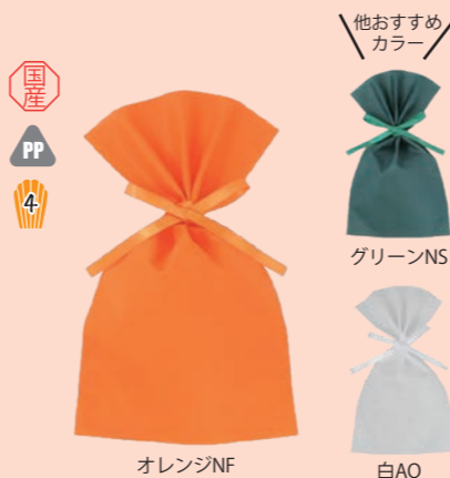
ソフトバッグベーシック 2穴リボン巾着

※ 下記掲載色以外にも、カラーを豊富に取り揃えております。詳しくはお問い合わせください。