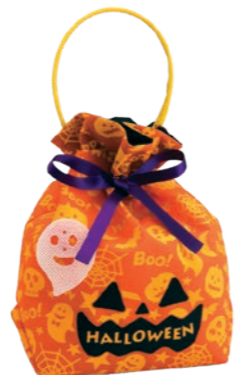
パンプキンリボンバッグ