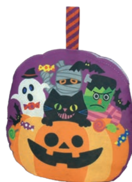
バルーン ハロウィンギャング F P