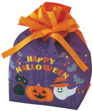
巾着 リボン小FP LA405 ハロウィンフレンズ柄 S 内寸：130×150×100 外寸：130×215×100 M 底板/厚紙、サテンリボン