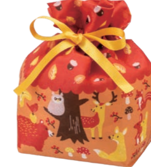
巾着 リボン小FP LA469 森のどうぶつ秋柄 S 内寸：130×150×100 外寸：130×215×100 M 底板/厚紙、サテンリボン