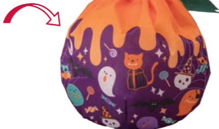
おてだま巾着 かぼちゃ F P