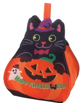
ころりん 黒猫かぼちゃ F P