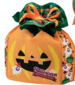
スクエア巾着 ハロウィンゴースト F P