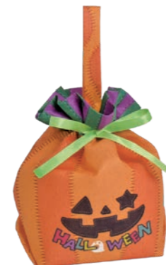
手提げリボンバッグ F P