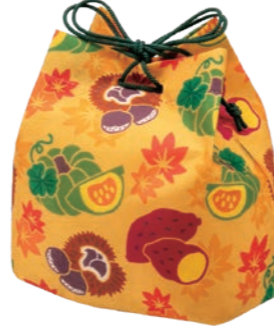
信玄袋FP LA468 いもくりなんきん柄 S 内寸：134×148×96 外寸：134×170×96 M 底板/厚紙、PPロープ